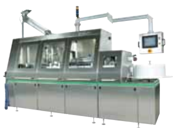
Автоматическая линия розлива ELI для пакетов объемом 500 мл и 1000 мл